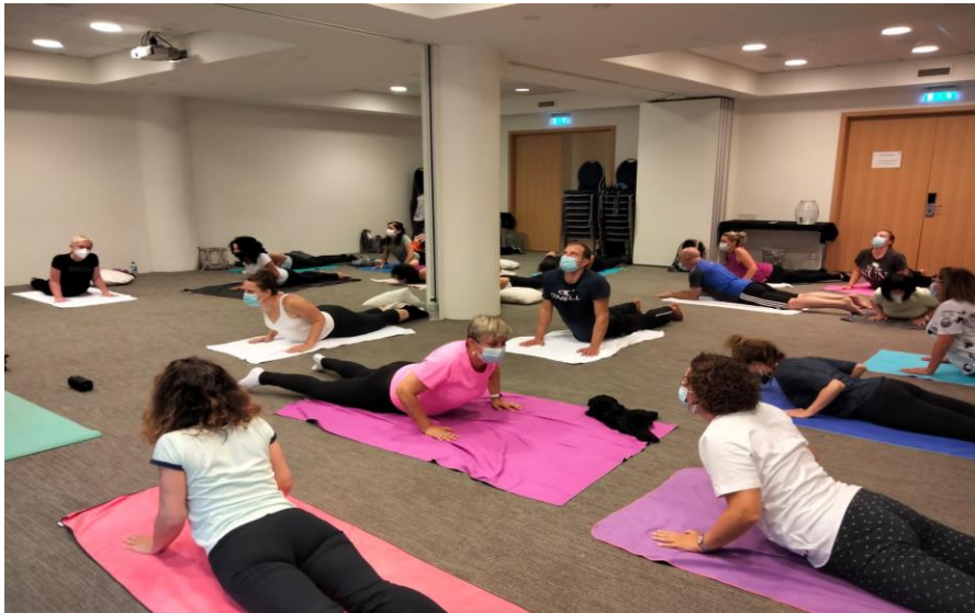
Jóga o 8 ráno