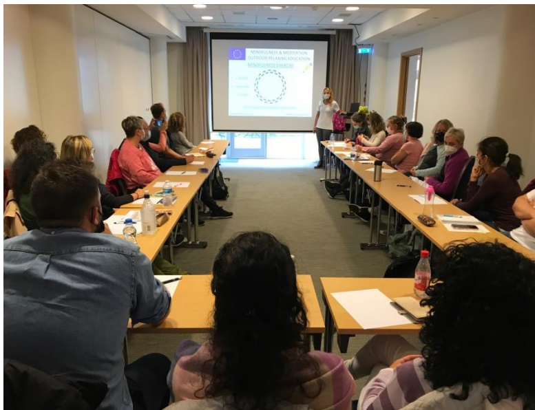
Prednášky a prezentácie

Väčšina z účastníkov si zaplatila tzv. kultúrny balíček, v rámci ktorého sme mali kúpanie sa v ikonickej Modrej lagúne. Sú to najnavštevovanejšie kúpele na Islande, nachádzajú sa v lávovom poli a voda je do lagúny privádzaná z blízkej geotermálnej elektrárne. Unikátna voda a kremičité bahno majú vynikajúci vplyv na pokožku a liečia mnohé kožné problémy.