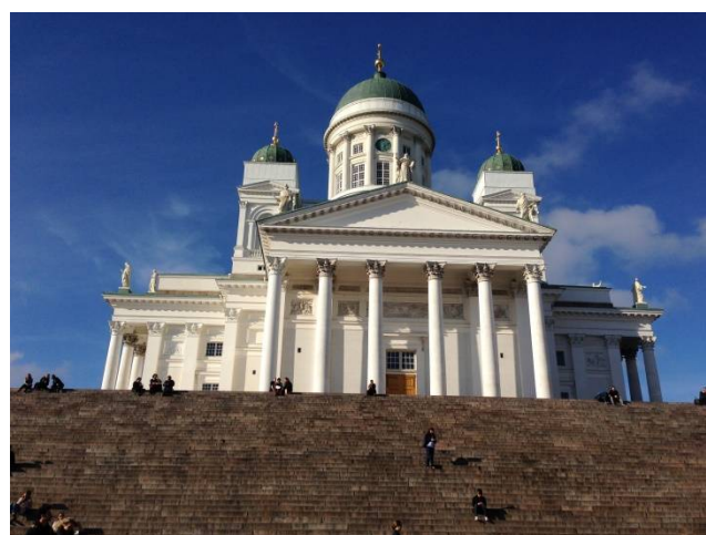
Obr. 3 - Helsinská katedrála