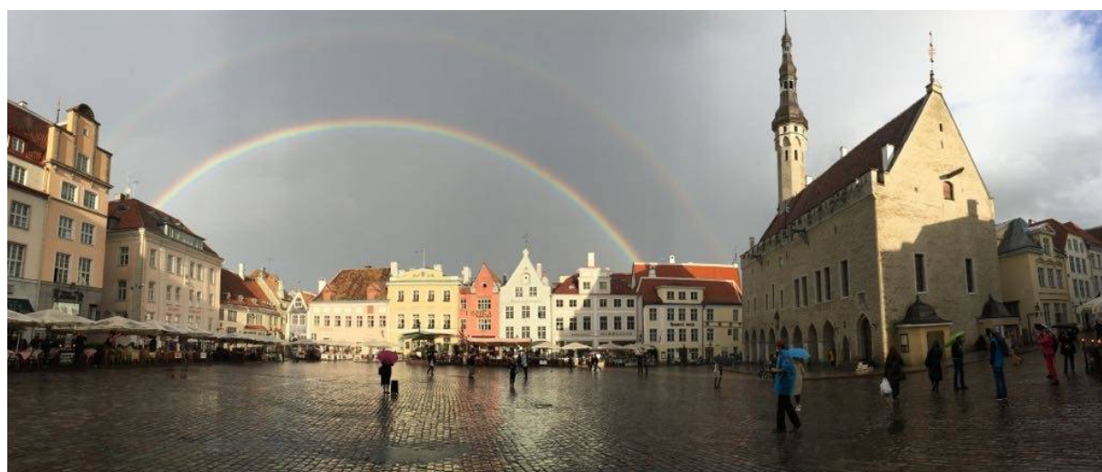
Obr. 5 – Radničné námestie v Tallinne