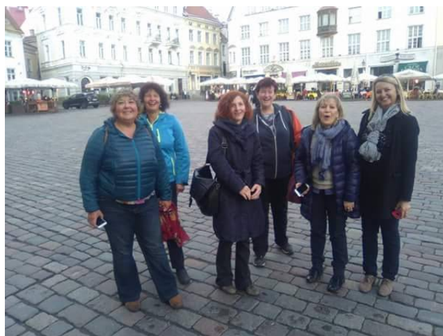
Obr. 2 – Prehliadka Tallinnu